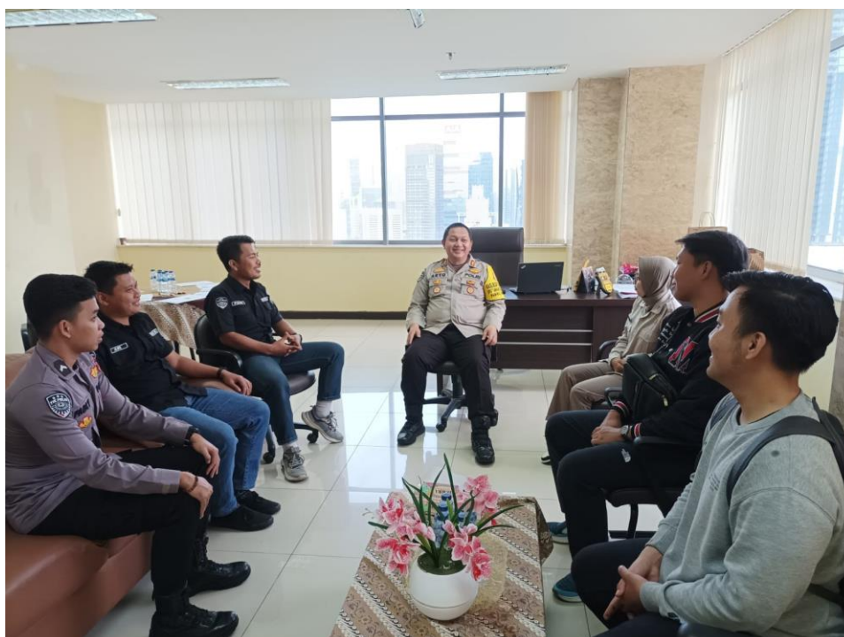
Gambar 3.3 Rapat Pembentukan Tim Efektif

Berikut adalah dokumentasi saat pembentukan tim efektif proyek perubahan: