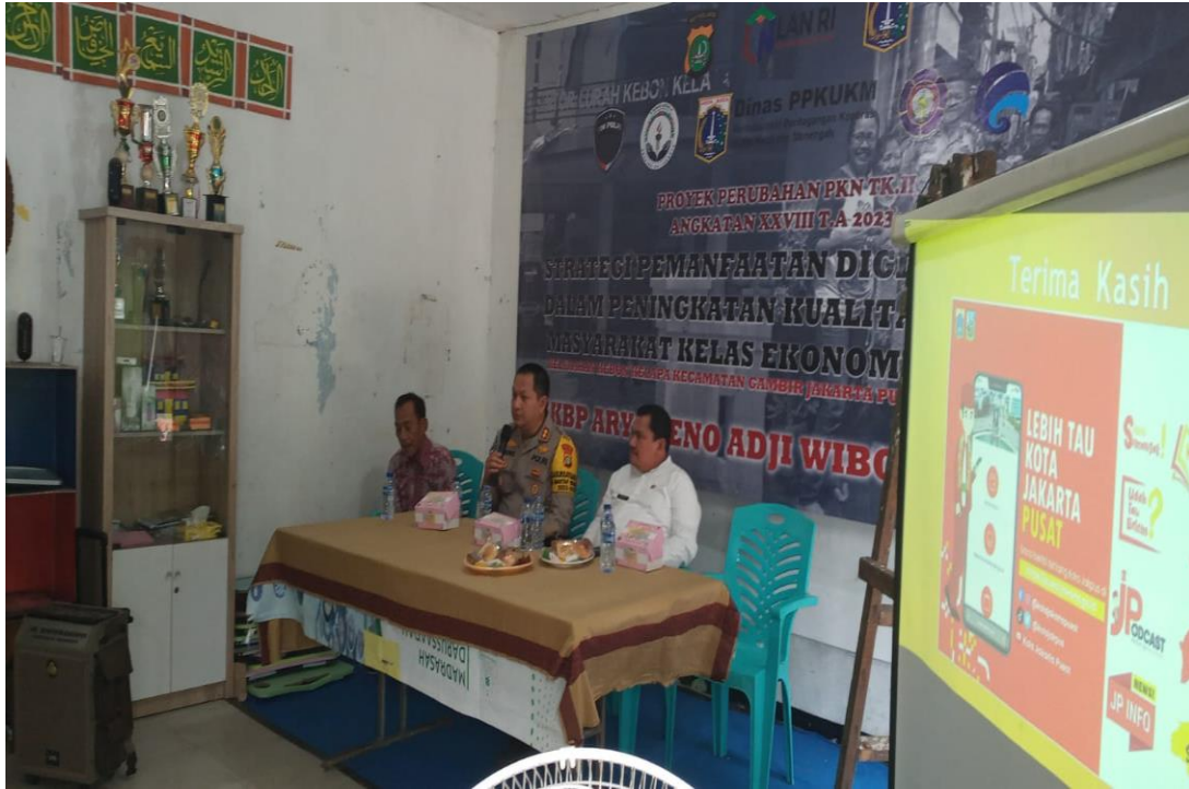
Gambar 3.20 Kegiatan Sosialisasi Suku Dinas Kominfotik Di Wilayah RW 01