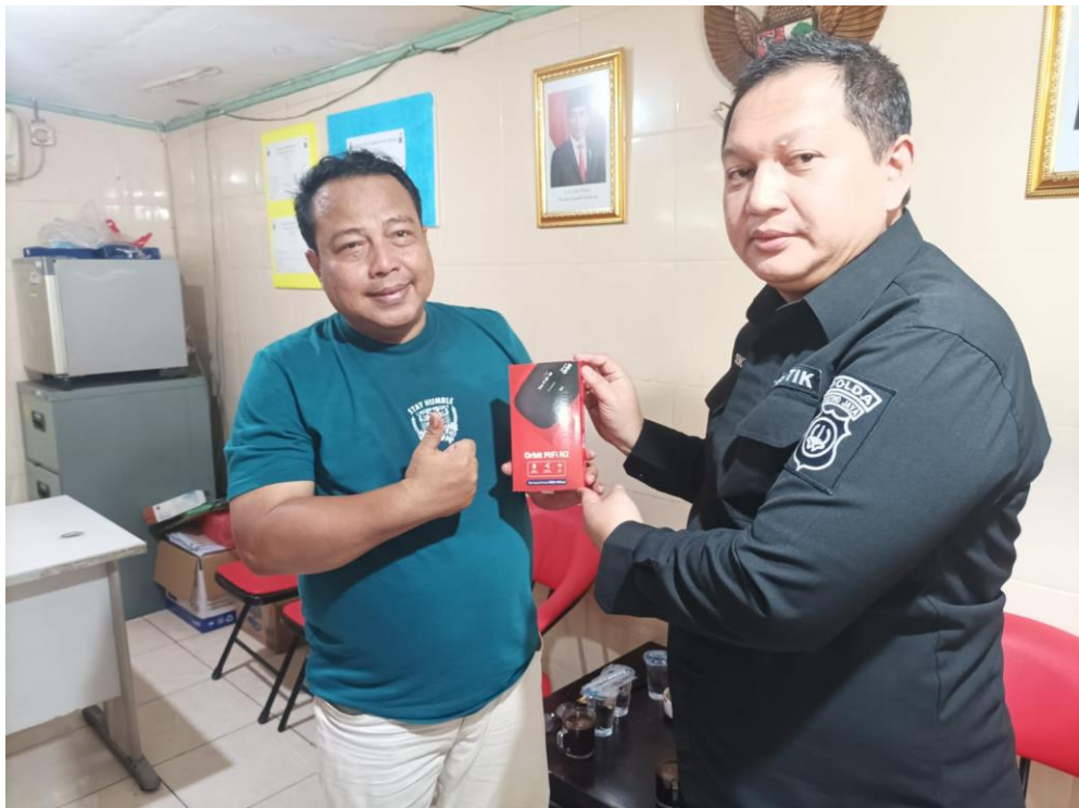
Gambar 3.30 Penyerahan Modem Wi-Fi Kepada Ketua RW Kelurahan Kebon Kelapa

Selain itu, untuk keberlanjutan jangka panjang proyek perubahan ini, Project Leader memberikan suatu bantuan kepada beberapa RW di Kelurahan Kebon Kelapa berupa Modem Wi-Fi yang nantinya untuk menunjang segala kegiatan warga di Kelurahan Kebon Kelapa yang membutuhkan jaringan internet dalam mengakses segala informasi tersebut selama 1 tahun.