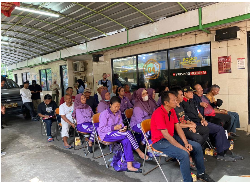
Gambar 3.17 Kegiatan Sosialisasi Suku Dinas Sosial Di Wilayah RW 04