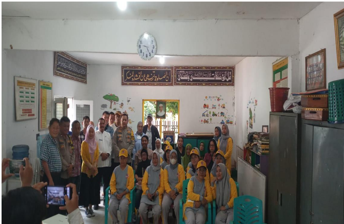
Gambar 3.19 Kegiatan Sosialisasi Suku Dinas Kominfotik Di Wilayah RW 01