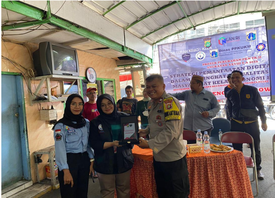
Gambar 3.16 Kegiatan Sosialisasi Suku Dinas Sosial Di Wilayah RW 04