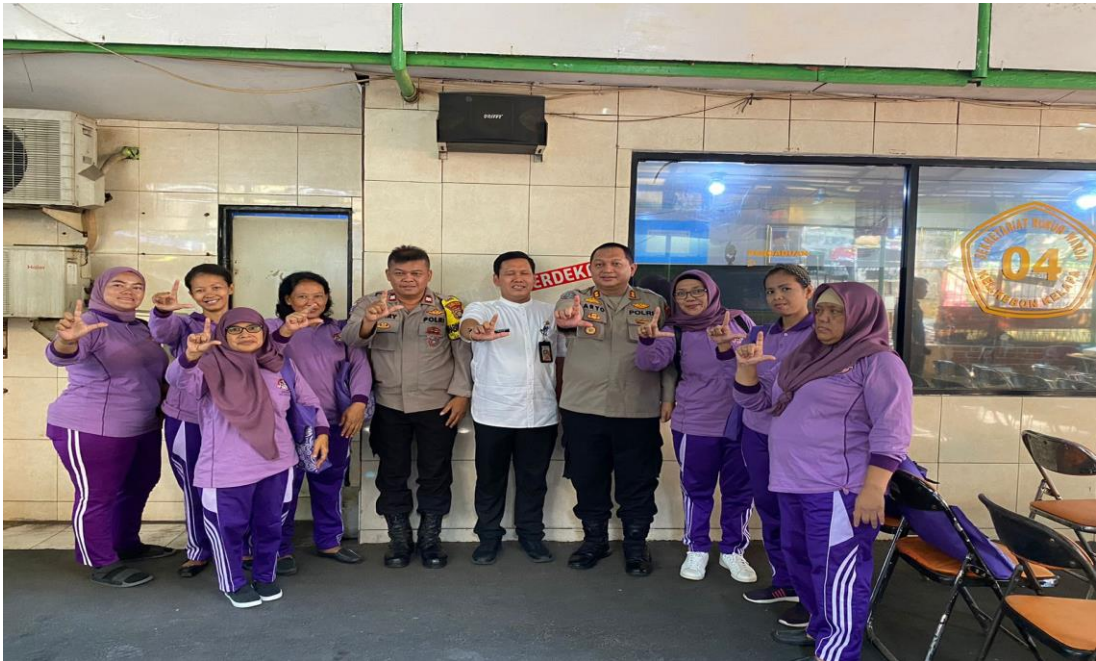
Gambar 3.14 Kegiatan Sosialisasi Suku Dinas Sosial Di Wilayah RW 04