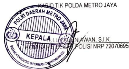
Gambar 3.1 Surat Perintah Tim Efektif

Dikeluarkan di: Jakarta pada tanggal : 05 Oktober 2023