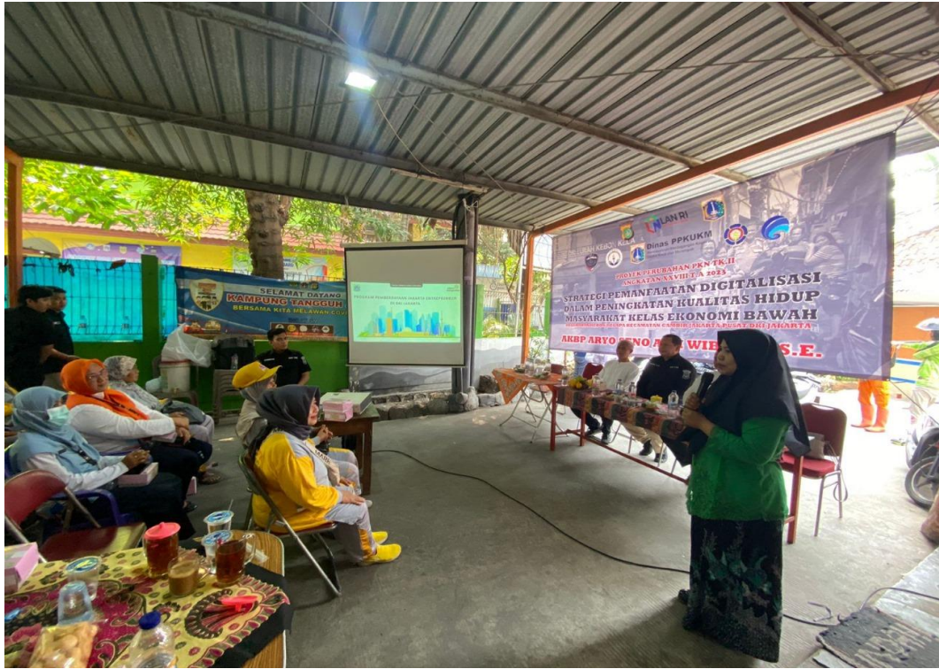
Gambar 3.24 Kegiatan Sosialisasi Suku Dinas PPKUM Di Wilayah RW 02