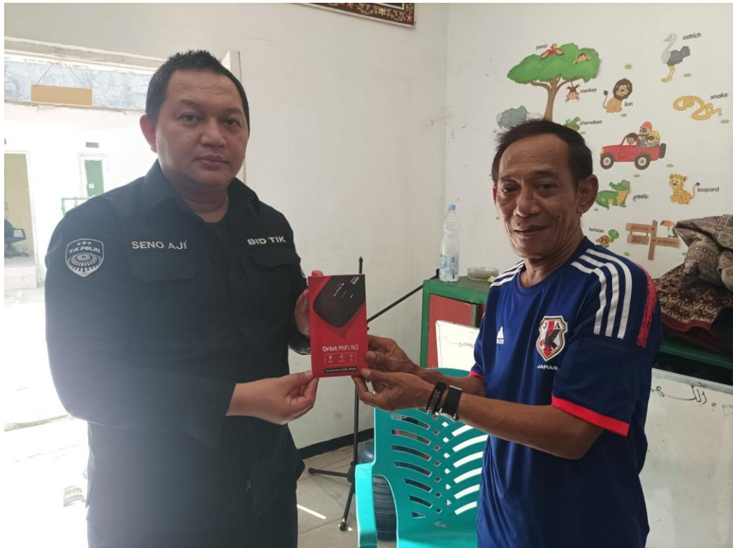
Gambar 3.31 Penyerahan Modem Wi-Fi Kepada Ketua RW Kelurahan Kebon Kelapa