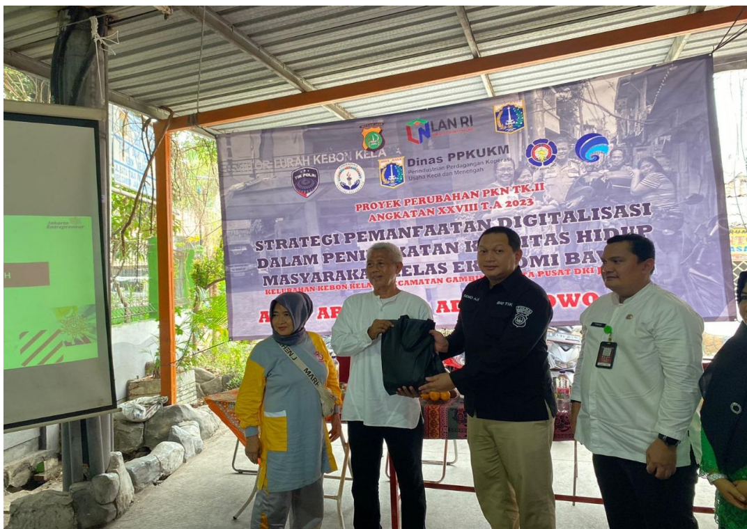
Gambar 3.23 Kegiatan Sosialisasi Suku Dinas PPKUKM Di Wilayah RW 02