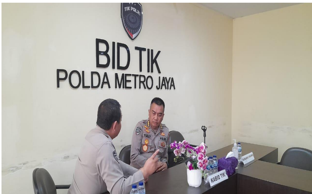
Gambar 3.7 Konsultasi Dengan Mentor