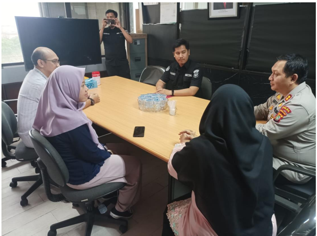
Gambar 3.11 Koordinasi Dengan Suku Dinas Kominfo