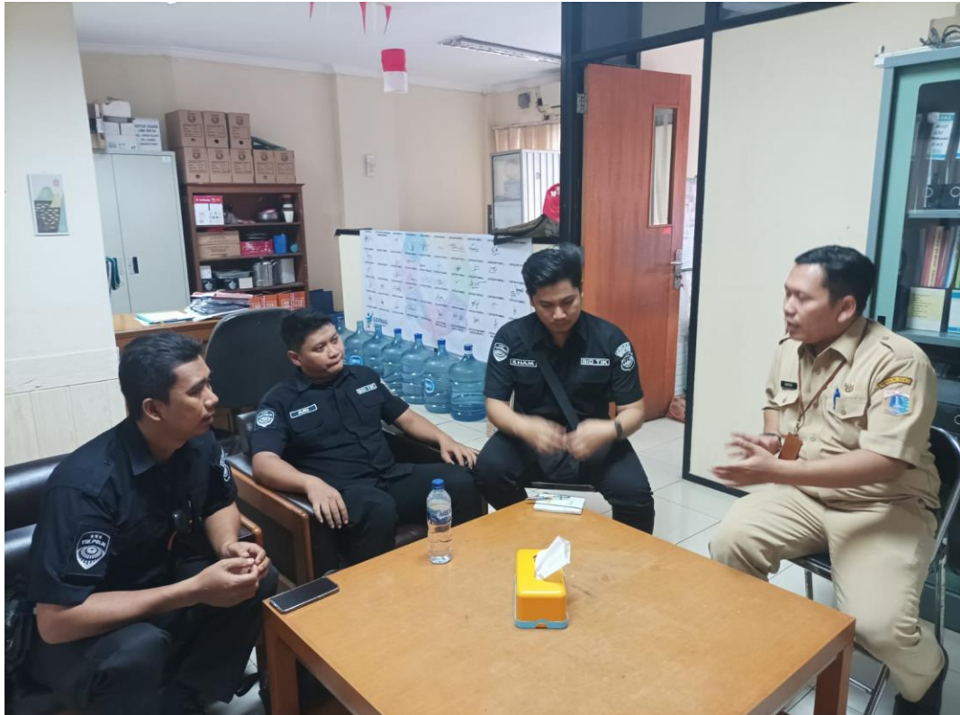
Gambar 3.8 Koordinasi Dengan Pihak Kelurahan Kebon Kelapa