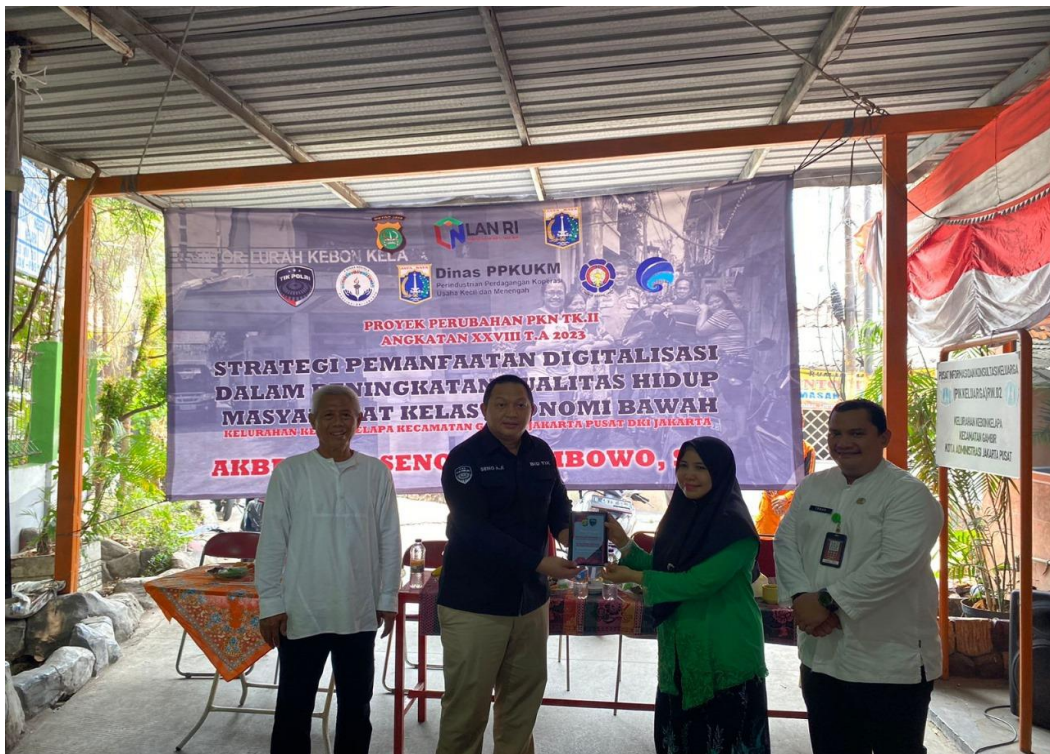
Gambar 3.25 Kegiatan Sosialisasi Suku Dinas PPKUM Di Wilayah RW 02