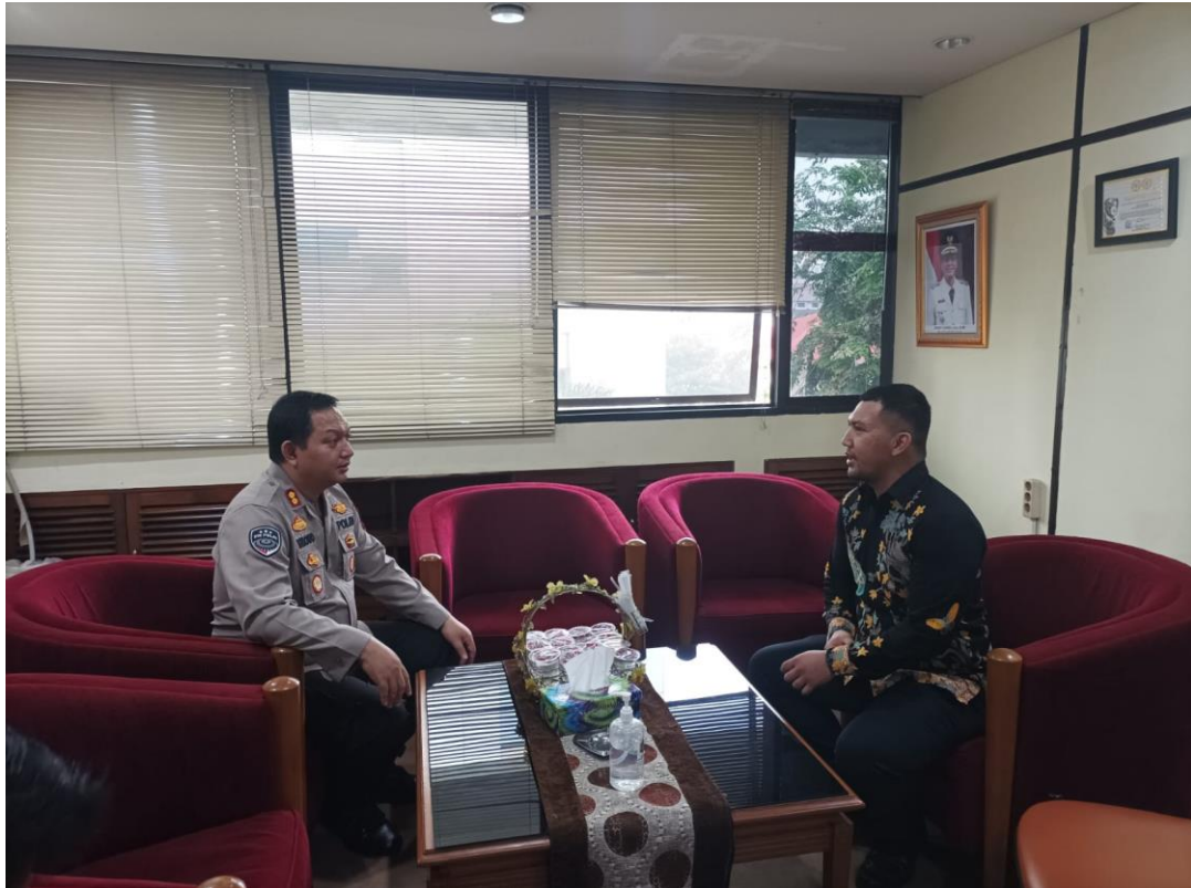
Gambar 3.10 Koordinasi Dengan Suku Dinas Sosial