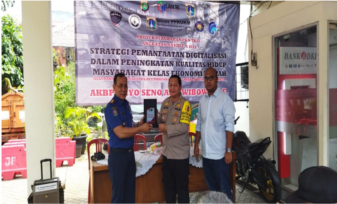
Gambar 3.28 Kegiatan Sosialisasi Suku Dinas Penanggulangan Kebakaran dan Penyelamatan Di Wilayah RW 03