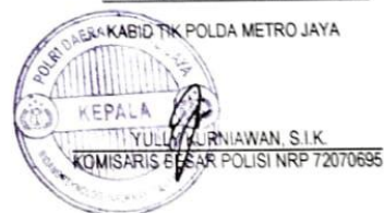
Gambar 3.2 Surat Perintah Tim Efektif

Dikeluarkan di: Jakarta pada tanggal: 05 Oktober 2023