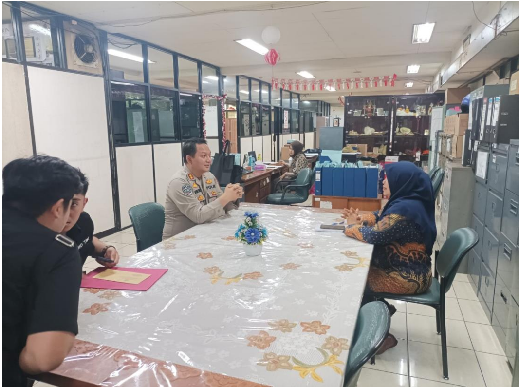
Gambar 3.12 Koordinasi Dengan Suku Dinas PPKUKM