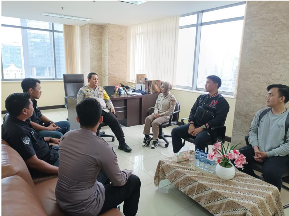
Gambar 3.4 Rapat Pembentukan Tim Efektif