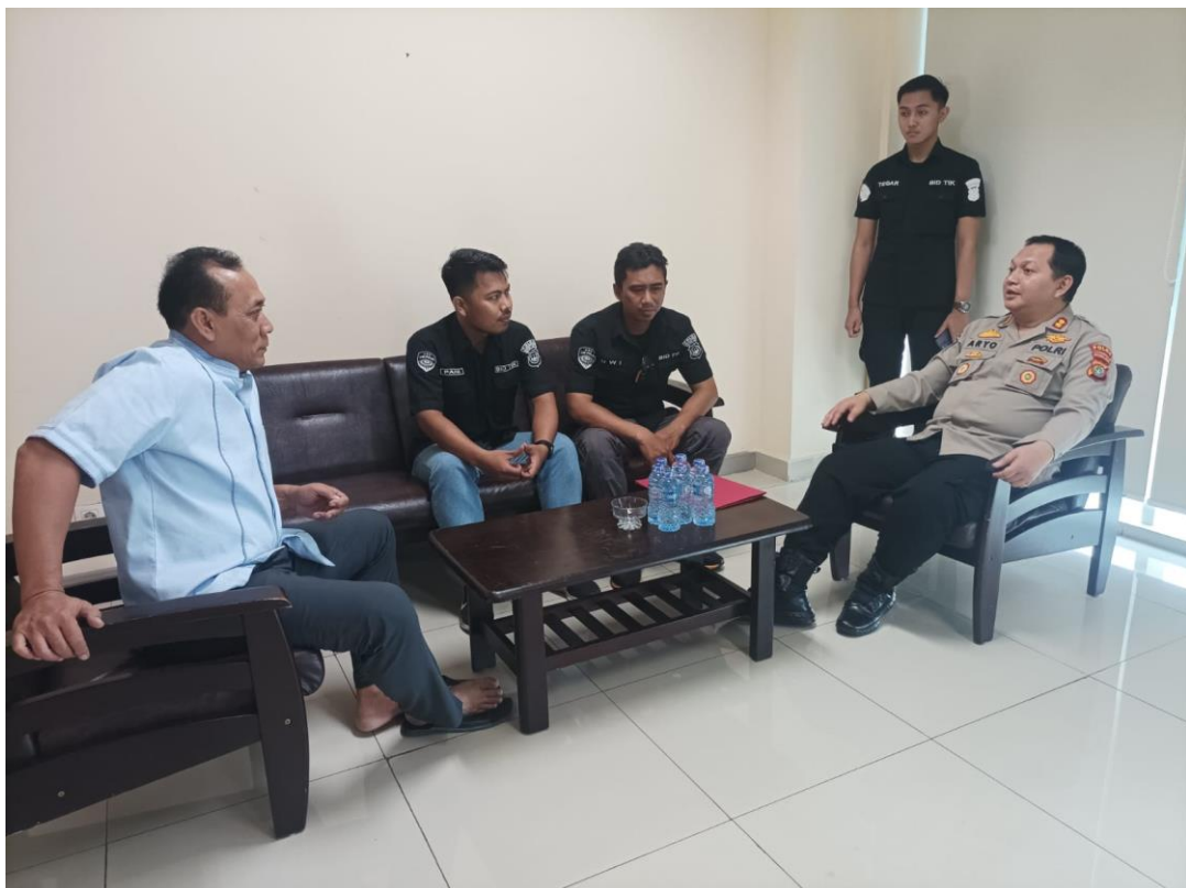
Gambar 3.13 Koordinasi Dengan Suku Dinas Penanggulangan Kebakaran dan Penyelamatan