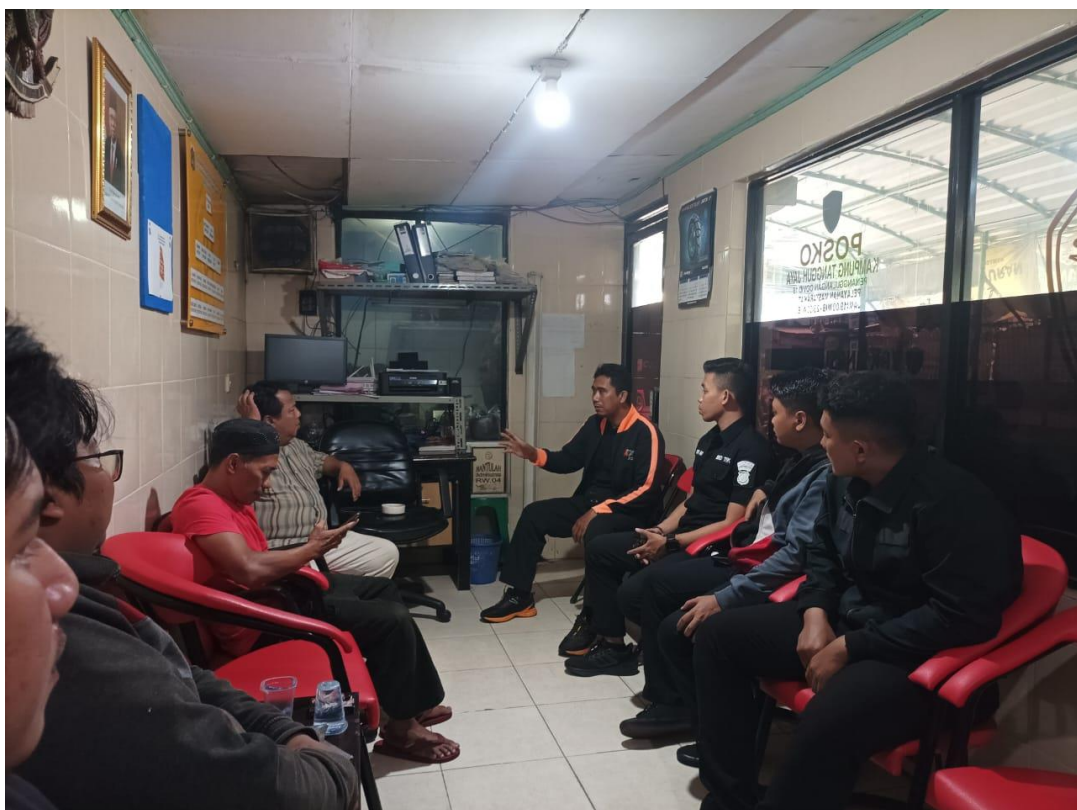
Gambar 3.9 Koordinasi Dengan Beberapa RW