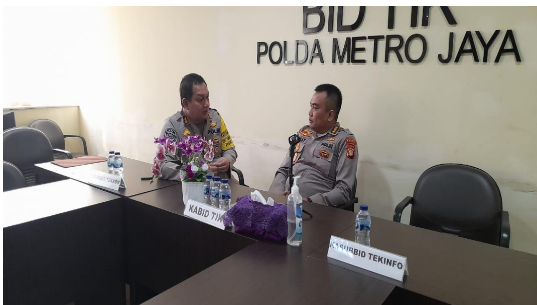
Gambar 3.5 Konsultasi Dengan Mentor

Mentor memberikan arahan terkait lokasi dan pengembangan kegiatan proyek perubahan. Berikut dokumentasi konsultasi bersama mentor: