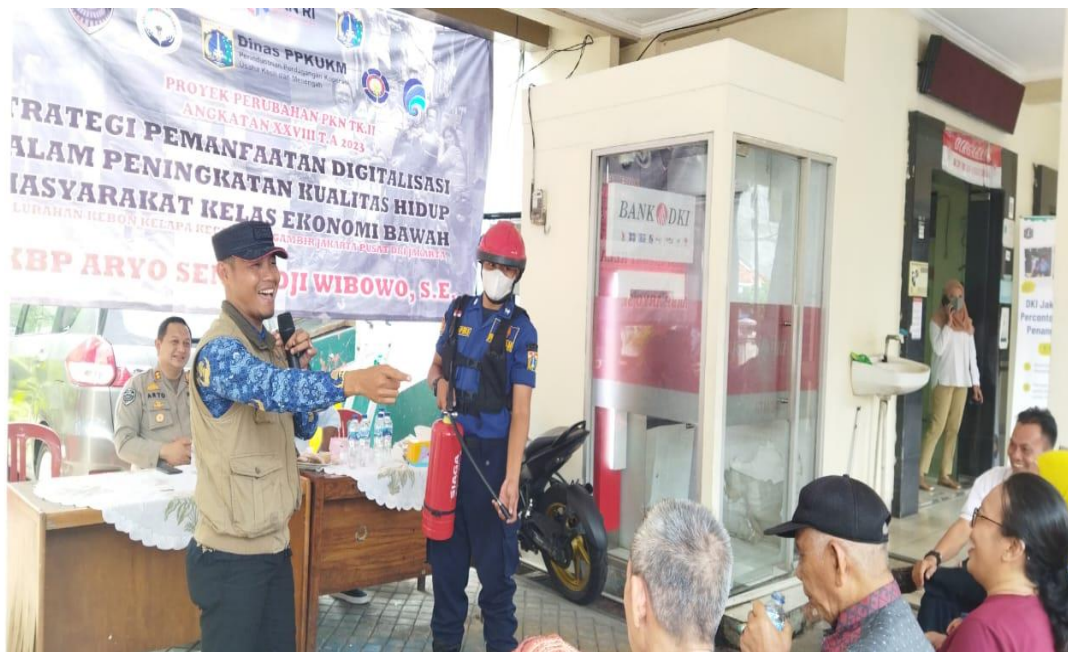
Gambar 3.27 Kegiatan Sosialisasi Suku Dinas Penanggulangan Kebakaran dan Penyelamatan Di Wilayah RW 03