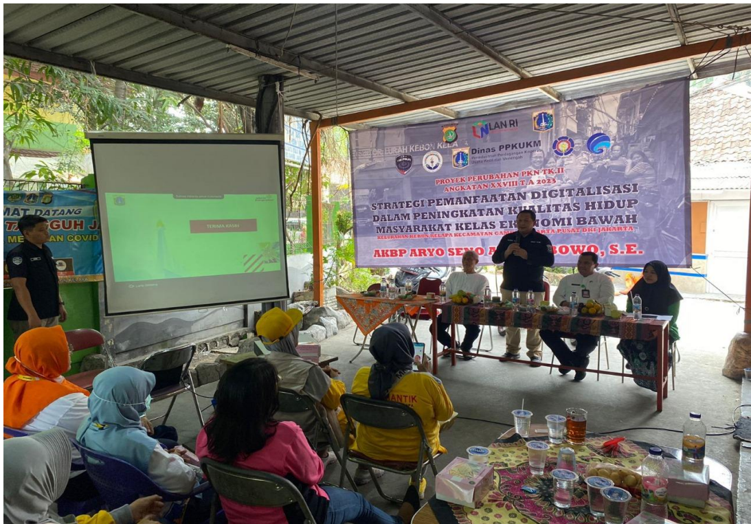
Gambar 3.22 Kegiatan Sosialisasi Suku Dinas PPKUKM Di Wilayah RW 02