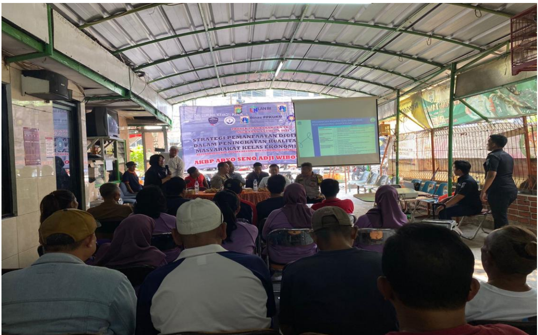
Gambar 3.15 Kegiatan Sosialisasi Suku Dinas Sosial Di Wilayah RW 04