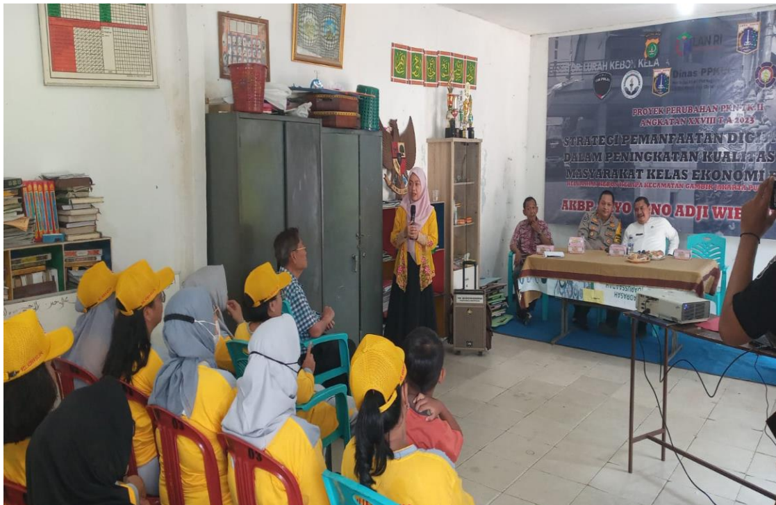
Gambar 3.18 Kegiatan Sosialisasi Suku Dinas Kominfotik Di Wilayah RW 01