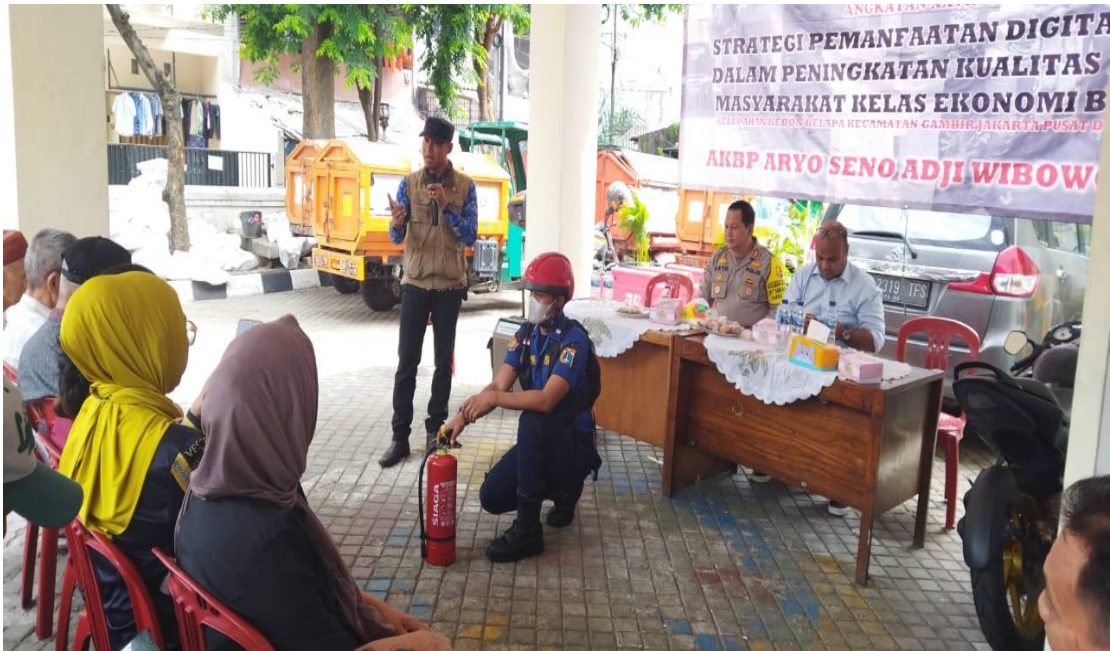
Gambar 3.26 Kegiatan Sosialisasi Suku Dinas Penanggulangan Kebakaran dan Penyelamatan Di Wilayah RW 03