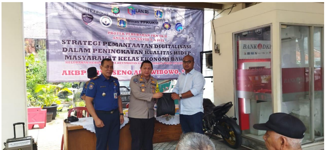
Gambar 3.29 Kegiatan Sosialisasi Suku Dinas Penanggulangan Kebakaran dan Penyelamatan Di Wilayah RW 03