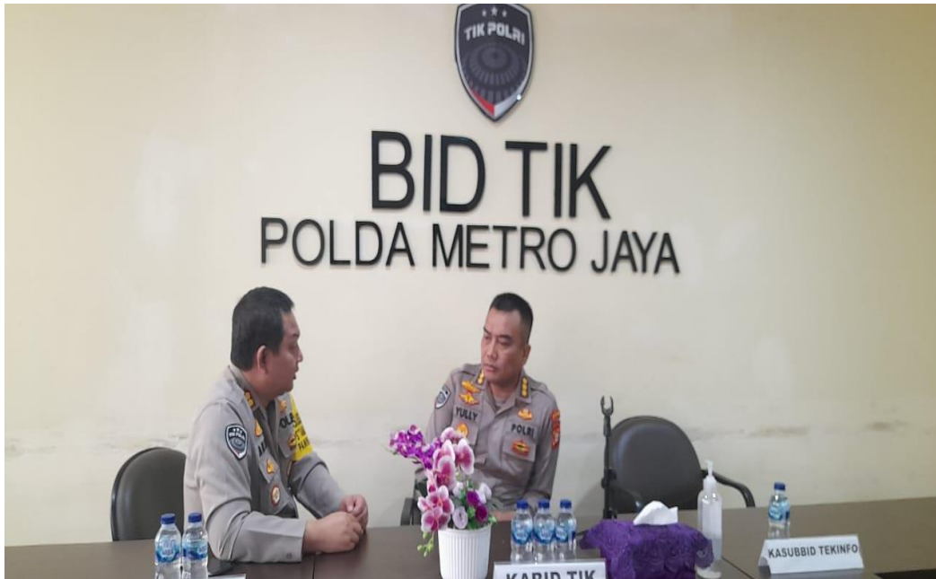
Gambar 3.6 Konsultasi Dengan Mentor