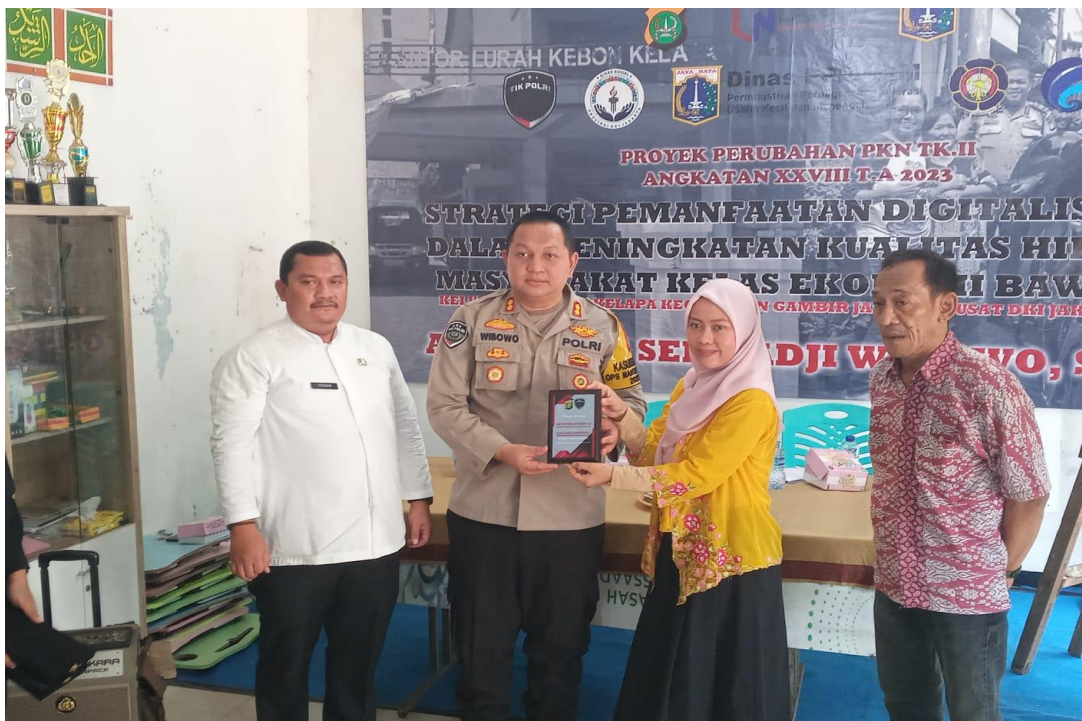
Gambar 3.21 Kegiatan Sosialisasi Suku Dinas Kominfotik Di Wilayah RW 01